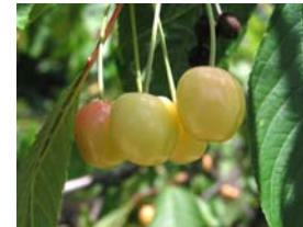
81 – začátek zrání