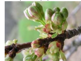
53 – pukání pupenů