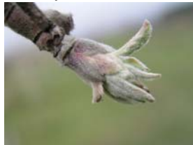
54 – myší ouško