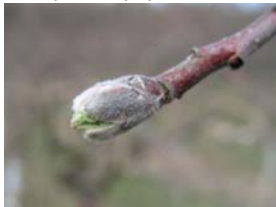
53 - pukání pupenů