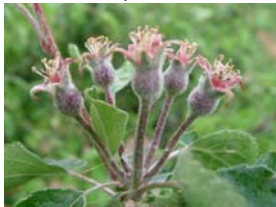
71 – velikost plůdků do 10 mm