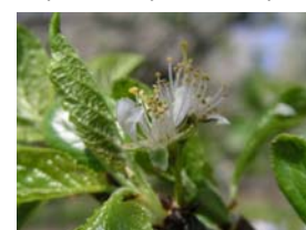
66 – počátek opadu květ. plátků