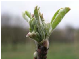
55 – viditelné květní pupeny