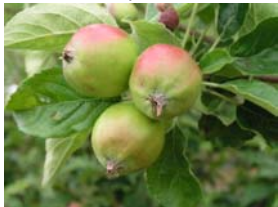
74 – velikost plodů do 40 mm