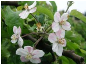
66 – opad prvních květ. plátků