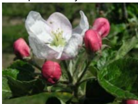
60 – první květy otevřené