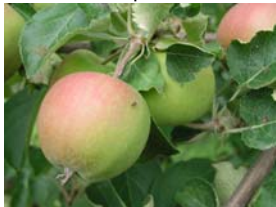
75 – velikost plodů 50%