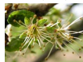
67 – většina plátků opadla