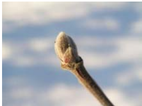
00 – vegetační klid