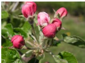
59 – stádium balónku