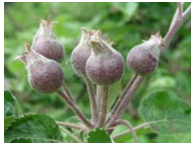
72 – velikost lískového oříšku