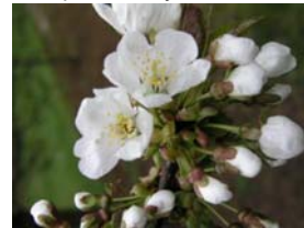
60 – první květy otevřené