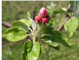
57 – růžové poupě