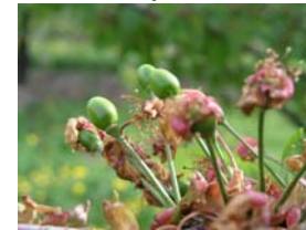
71 – narůstající semeník