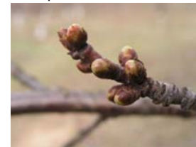
51 – počátek rašení