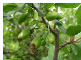
71 – narůstající semeník