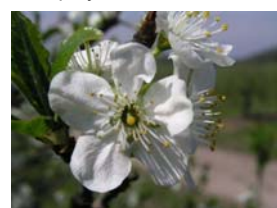
65 – plný květ