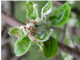
56 – zelené poupě