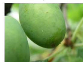
77 – velikost plodů 70%