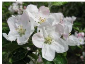
65 – plné kvetení