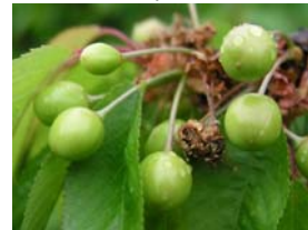
75 – velikost plodů 50%