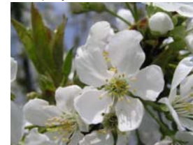
65 – plný květ